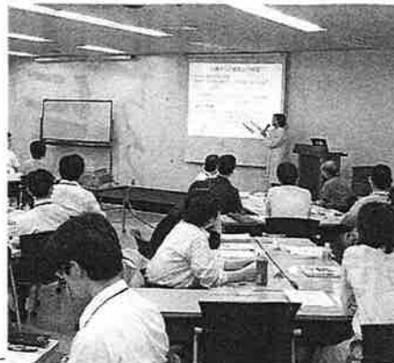
健康相談員の制度維持へ随時セミナーを実施している (東京都武蔵野市の本社)